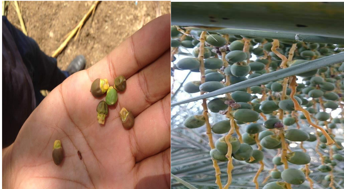
شكل يوضح مظاهر الإصابة بدودة البلح الصغرى

من الآفات الحشرية التي تصيب الثمار، و في حالة اشتداد الإصابة تؤدي الى فقد كمية كبيرة من المحصول. وتهاجم اليرقات الأزهار والثمار الصغيرة بعد العقد في مرحلة الحبابوك وتؤدي الإصابة إلى تساقط الأزهار والثمار الصغيرة ، ونتيجة لدخول اليرقة إلى داخل الثمار الصغيرة والتغذية على محتوياتها ، تصبح معظم الثمار يابسة ومعلقة بالشماريخ بواسطة نسيج حريري تفرزه اليرقة بينما يسقط الجزء الآخر عند الإصابة يتحول لون الثمرة إلى اللون الأحمر ، كما تصيب الحشرة الثمار أحياناً طوري الخلال والبسر، ويطلق على الحشرة اسم الحميرة نسبة لتحول لون الثمار المصابة إلى اللون الأحمر. وتتم مكافحة باستخدام المبيد الموصى به من قبل وزارة الزراعة في حالة الإصابة الشديدة ، وترش الأشجار رشة واحدة بأحد هذه المبيدات لترك الفرصة للطفيليات التي تتطفل على هذه الحشرة والتي تتبع رتبة غشائية الأجنحة.