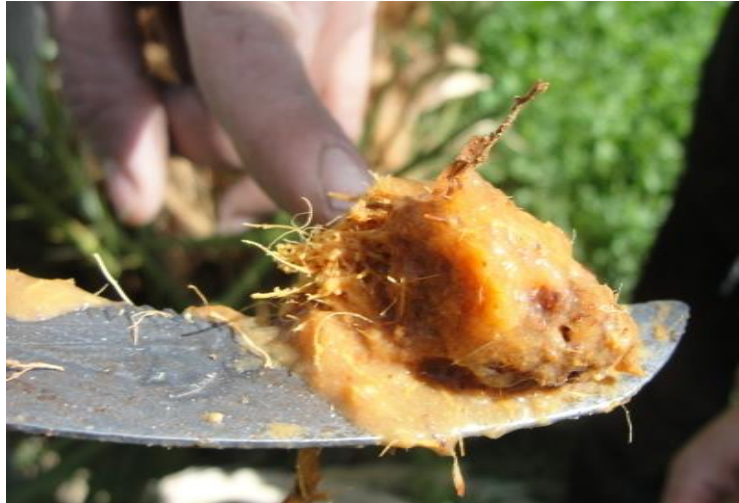
إفرازات نتيجة الإصابة