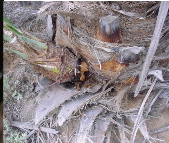
أصابه الفسائل ملتصقة بالأم