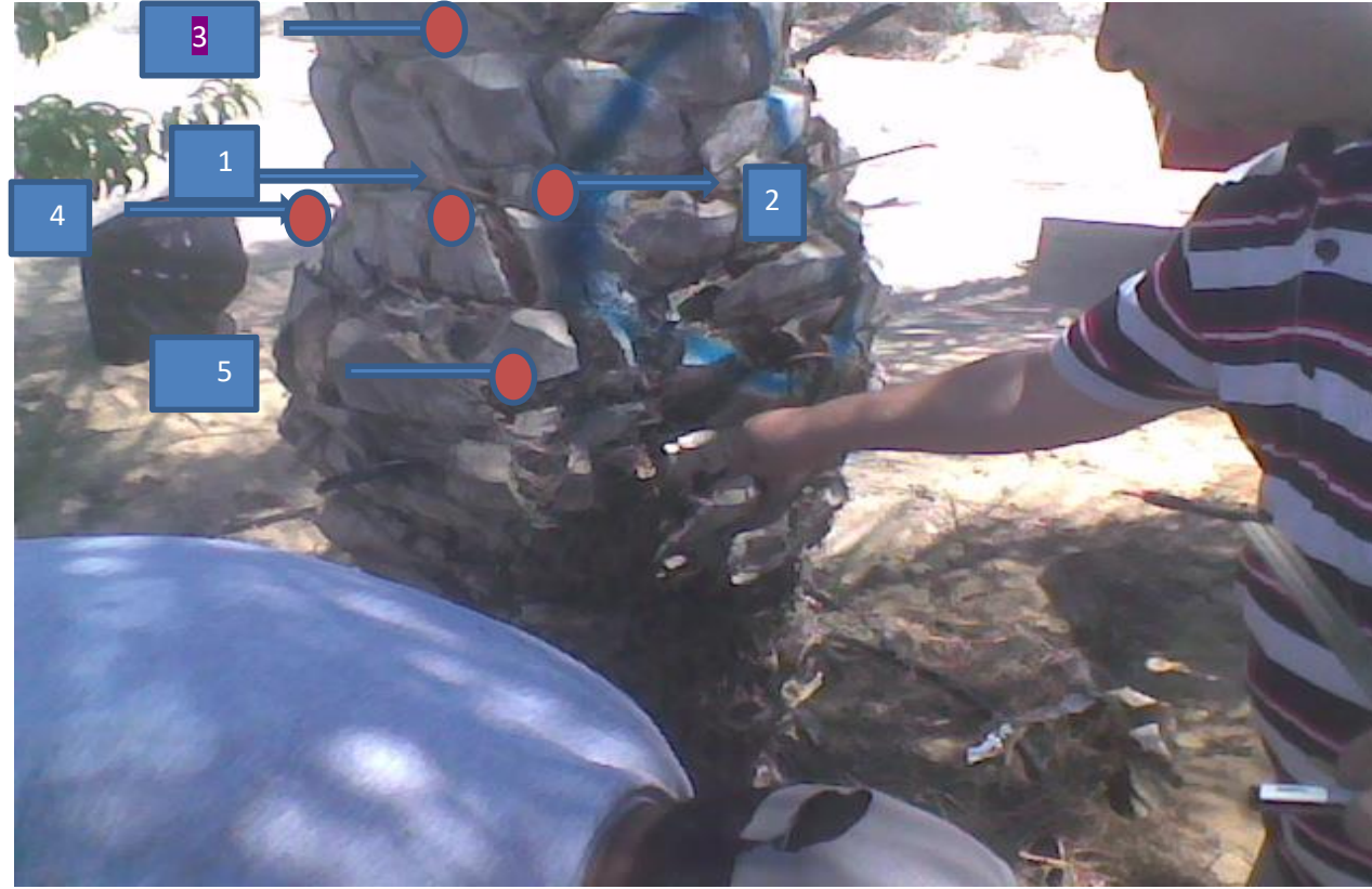
رسم تخطيطي لأماكن الثقوب