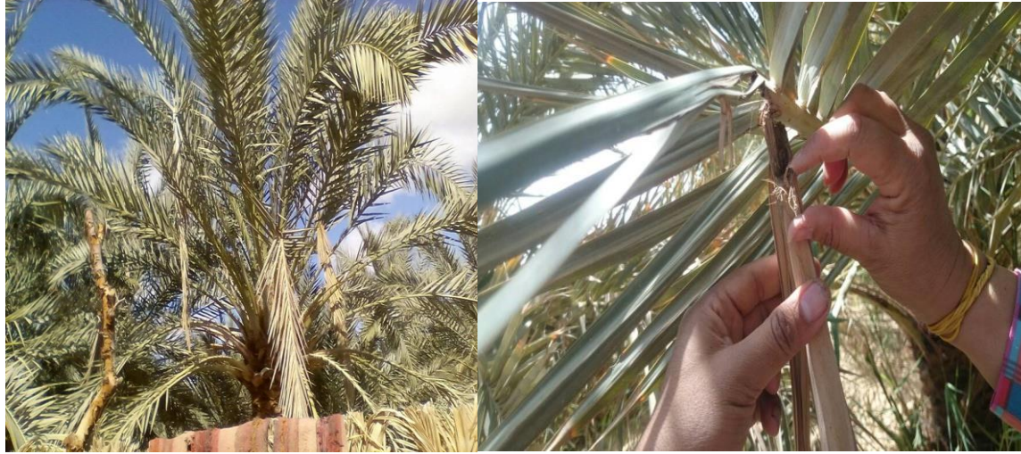
شكل رقم (1) يوضح مظاهر الإصابة بحفار سعف النخيل