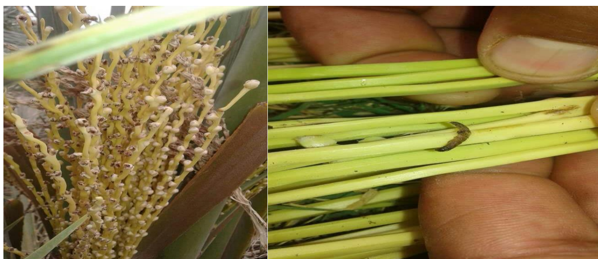
الشماريخ في العذوق خالية من الثمار