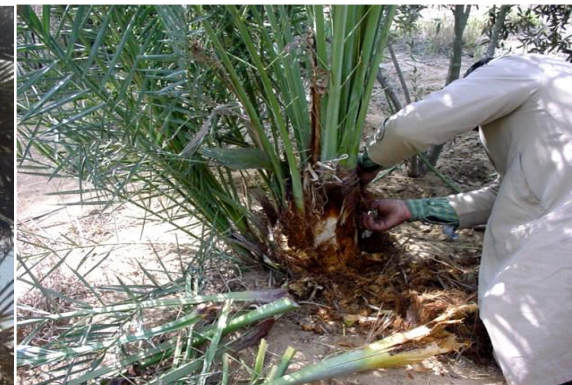
مشاهدة الإصابة في الفسائل في المنطقة الملاصقة