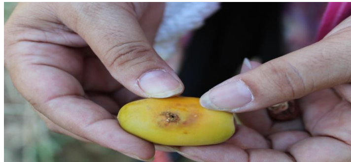
أبي دقيق رمان

تصيب هذه الحشرة ثمار الرمان من شهر مايو حتى سبتمبر ، والبلح من شهر أغسطس حتى أكتوبر والأكاسيا طول العام ، كما وجد أنها تصيب ثمار الجوافة والبشملة وقرون الخروب الخضراء. وتظهر أعراض الإصابة بظهور ثقوب على الثمار يحيطها براز اليرقة وإفرازات سوداء وينشأ الضرر من اليرقات التي تحفر في الثمرة وقد تهجر لتصيب ثمار أخرى مما يتسبب عنه زيادة الإصابة ، ويدخل خلال هذه الثقوب فطريات وبكتيريا التعفن وكثير من الحشرات مثل الدروسوفيللا وخنفس الثمار الجافة التي تقضى على بقية الثمر.