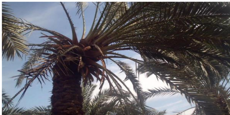
أنحاء قمة النخلة قبل تساقطها لسطح الأرض واصفرار الأوراق وتهديها