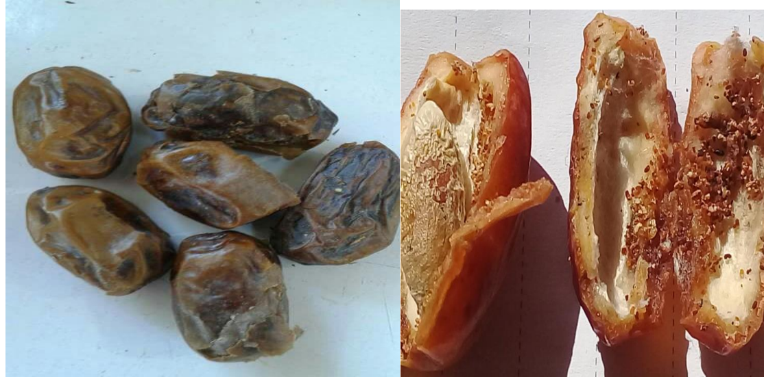
شكل يوضح مظاهر الإصابة لدودة بلح الواحات

توجد يرقات هذه الحشرة على البلح الجاف في مصر والعراق وغيره من الأقطار العربية ويطلق عليها هذا الاسم في مصر لأنها تصيب محصول البلح في الواحات كما تصيب أيضا الزبيب واللوز، وتشبه دودة البلح الكبرى في الضرر بالثمار ، تضع الفراشة بيضها على الثمار وهي ما زالت على النخيل الذي يفقس عنه يرقات تتغذى على الثمار وتعتبر من آفات المخازن في مصر.