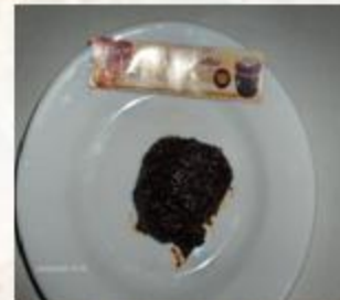
عجين للدهن من التمر و السمسم