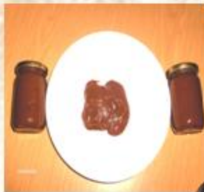
عجين للدهن من التمر و اللوز

عجائن التمر: مواد طبيعية للدهن مصنعة دون مواد حافظة أو مثبتة و هو منتج يستعمل كذلك لتثمين شراب التمر.