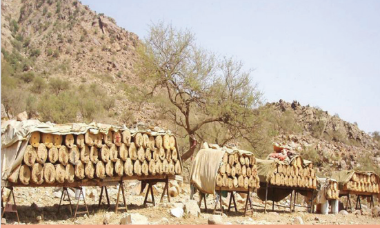
منحل متقل مكون من خلايا بلدية

الحشائش التي تتخذها الحشرات الضارة مأوى كالنمل والدبابير .