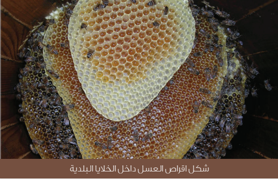
شكل اقراص العسل داخل الخلايا البلدية