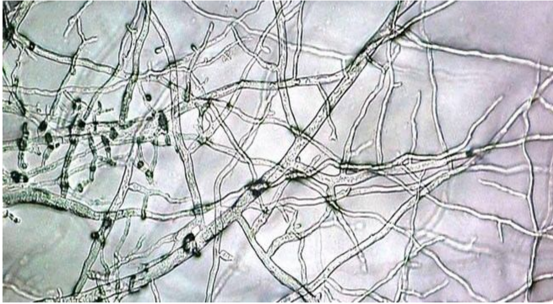
التمائل أو التداخل في تواجد الممرضات على الأجزاء النباتية المصابة من خلال المزرعة المائية