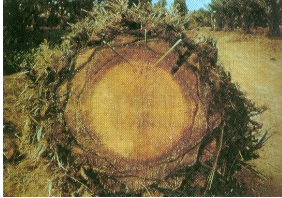
قطاع عرضي في جذع نخلة يبين تلون الحزم الوعائية المصابة بالفطر الممرض