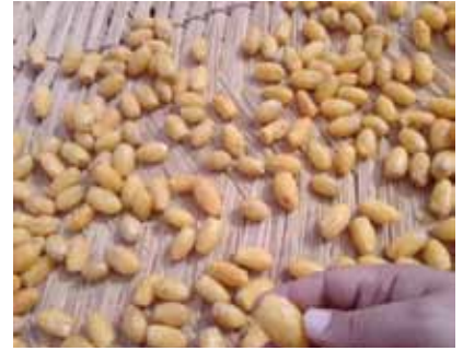
شكل رقم (٤): الثمار عقب عملية النقع في الماء المغلي المحتوي على ملح مضاد للأكسدة.