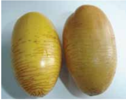
شكل رقم (١): ظهور تشققات على الثمار أثناء طور الخلال لصنف اوطاقن نتيجة لهطول الأمطار لساعتين متواصلتين بغزارة.