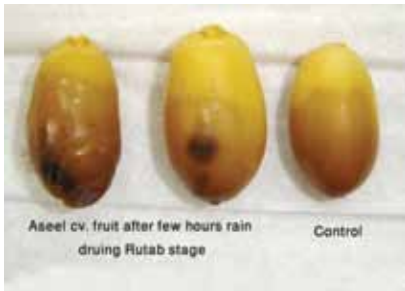
شكل رقم (٣): نمو الأعفان بالثمار وتشقق القشرة الخارجية لصنف الأصيل.