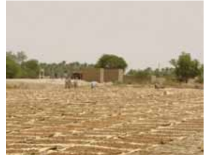
شكل رقم (٥): تشجير الثمار بعد ٥ أيام للجفاف في الشمس بعد نقعها في الماء المغلي.