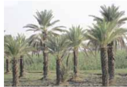
شكل رقم (٧): التحسن النسبي لحالة أشجار النخيل التي كانت تعاني من التأثير الشديد للملوحة بعد غسيل الأملاح نتيجة للفيضان.

استخدام غطاء غير منفذ للماء لتغطية السوباتات أثناء نضج الثمار في الفترة التي يحتمل فيها سقوط الأمطار وهي في منطقة الدراسة "خيربور" يونيو ويوليو وحتى جمع المحصول من على النخل. تغطية السوباتات يتم على نطاق واسع في مناطق أخرى من العالم مثل الولايات المتحدة الأمريكية - ولاية كاليفورنيا (٥) وهناك مواد عديدة تستخدم لذلك في مناطق أخرى من العالم ولكن لأغراض متعددة سواء لتوفير الرطوبة (حماية ثمار صنف الدباس وتوفير الرطوبة اللازمة لعدم حدوث تشققات بالقشرة الخارجية وتبكير المحصول في دولة الإمارات العربية المتحدة) أو حماية السوباتات من الآفات الحشرية والطيور، الرياح المحملة بالرمال، وفيها قد يستخدم غطاء شبكي مصنوع من النيلون والبلاستيك لتغطية السوباتات (٥). لذلك اجري المعهد دراسة على استخدام منتج شبه ورقي أبيض اللون، وشبه منفذ للضوء لتغطية الثمار وحمايتها حال سقوط الأمطار (شكل رقم ٩). توصلت الدراسة إلى أن التغطية بداية من منتصف يونيو إلى منتصف يوليو أدت إلى التبكير في جمع المحصول بأسبوع عن مثلها غير المغطاة في جميع الأصناف. التقليل من الإصابة الحشرية والتعرض للأتربة. كما لم تتأثر معنويًا الصفات الفيزيائية والكيميائية