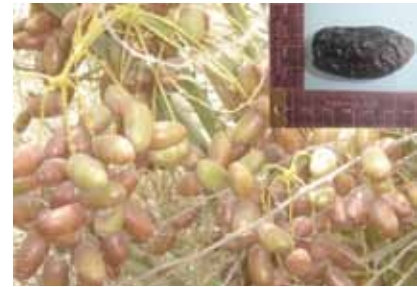
شكل رقم (٨): زراعة الأصناف المبكرة مثل صنف "صفاوي" المدخل من المملكة العربية السعودية.