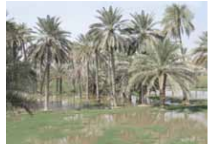
شكل رقم (٦): غمر بساتين النخيل بالماء لعدة شهور نتيجة للفيضانات.

التي وصلت إلى كامل مرحلة الخلال وبدأت في الترطيب. قبل الحصاد بأسبوع أو أسبوعين يتم جمع الثمار التي دخلت في مرحلة الترطيب من علي الشجر يدويا ثم تنشر في الشمس حتى تقل فيها نسبة الرطوبة. ويطلق عليها المزارعون هناك «تمر» dates وتزيد أسعاره عن النسبة الكبيرة من المحصول والتي يتم