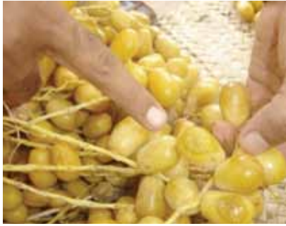
شكل رقم (٢): تخمر الثمار في أماكن الإصابات والخدوش بعد سقوط الأمطار لمدة ساعتين أثناء مرحلة الخلال لصنف الأصيل الباكستاني.