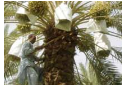
شكل رقم (٩) تغطية السوباتات خلال مرحلة الخلال للحماية من الأمطار.